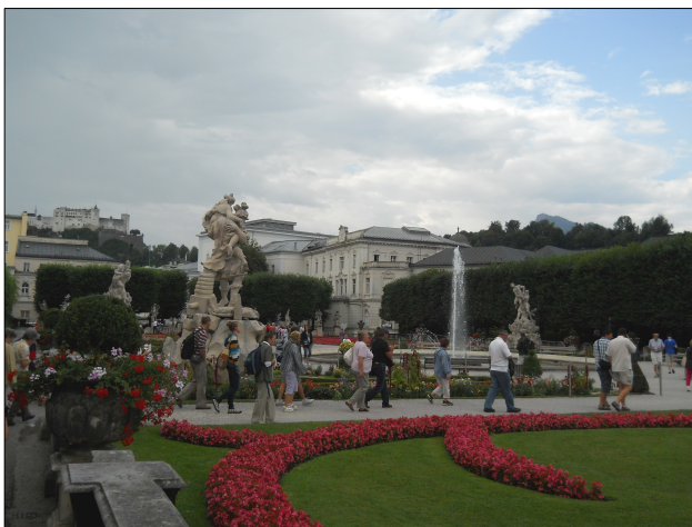
Salzburg, a Mirabell kastély parkja

Első nap a Großglockner Hochalpenstraße volt az úti cél, ennek kiindulópontja Heiligenblut helysége van, ez a Hoche Tauern nevű természetvédelmi terület (nemzeti park)