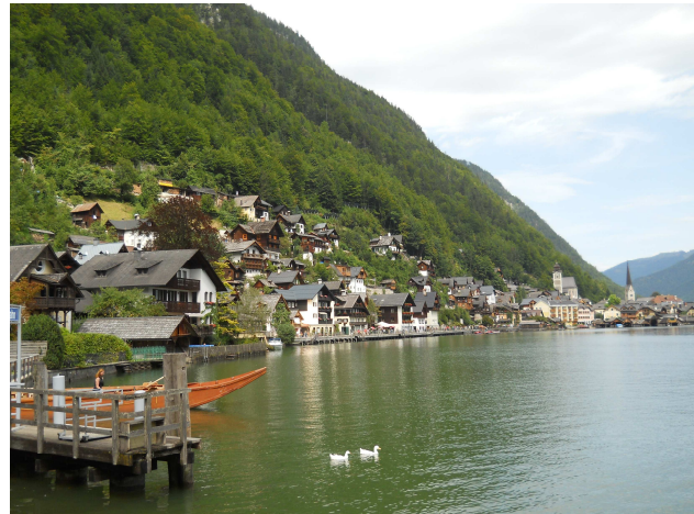
Hallstatt, kilátás a városra és a Hallstätter Seere

Innen pedig már hazafelé tartottunk. Egészében szép kirándulás volt, köszönet érte.